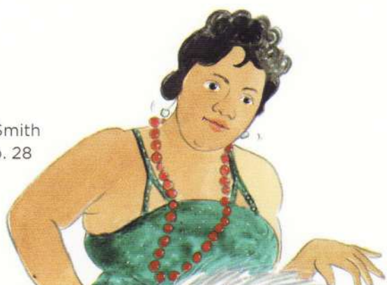
Mamie Smith Blues p. 28