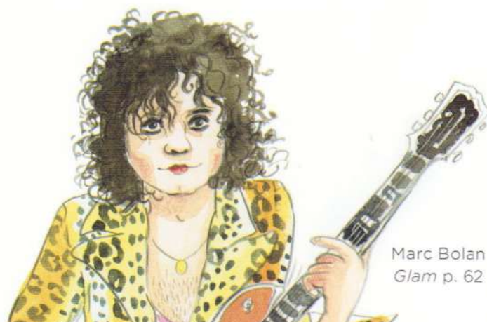
Marc Bolan Glam p. 62