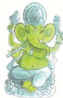
Ganesh e adesea reprezentat cântând la flaut.

Din cele mai vechi timpuri, oamenii au folosit muzica pentru a-și venera zii. Hindușii folosesc versuri din vechile lor texte sacre, Vedele, în imnuri și cântece religioase închinare marelui Shiva și altor zei hinduși, cum ar fi Ganesh, zeul-elefant. Și musulmanii folosesc cântecele în cultul lor. În secolul al XIII-lea, în India și Pakistanul de azi, musulmanii sufiți au dezvoltat un tip de muzică religioasă numit „qawwali“. Creștinii asociază adesea raiul cu un loc plin de coruri de îngeri, iar în cultul creștin din zilele noastre se cântă mult - gândește-te la slujbele speciale cu colinde din preajma Crăciunului sau la corurile afro-americane de gospel. Corurile creștine au luat ființă odată cu seninele cânturi gregoriene ale călugărilor europeni din secolul al VIII-lea. Acestea s-au transformat cu timpul în melodii numite „cantus planus“, unde toată lumea cânta aceeași linie melodică.